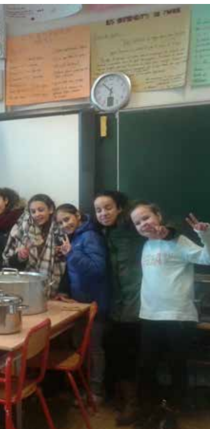
Les élèves ont rassemblé plus de 40 couvertures et préparé 60 litres de soupe pour réchauffer les sans-abris !