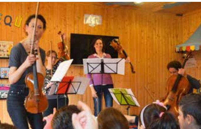
Prosperus4 présente ses instruments à cordes aux enfants

vmarage@anderlecht.brussels 0499 867 158