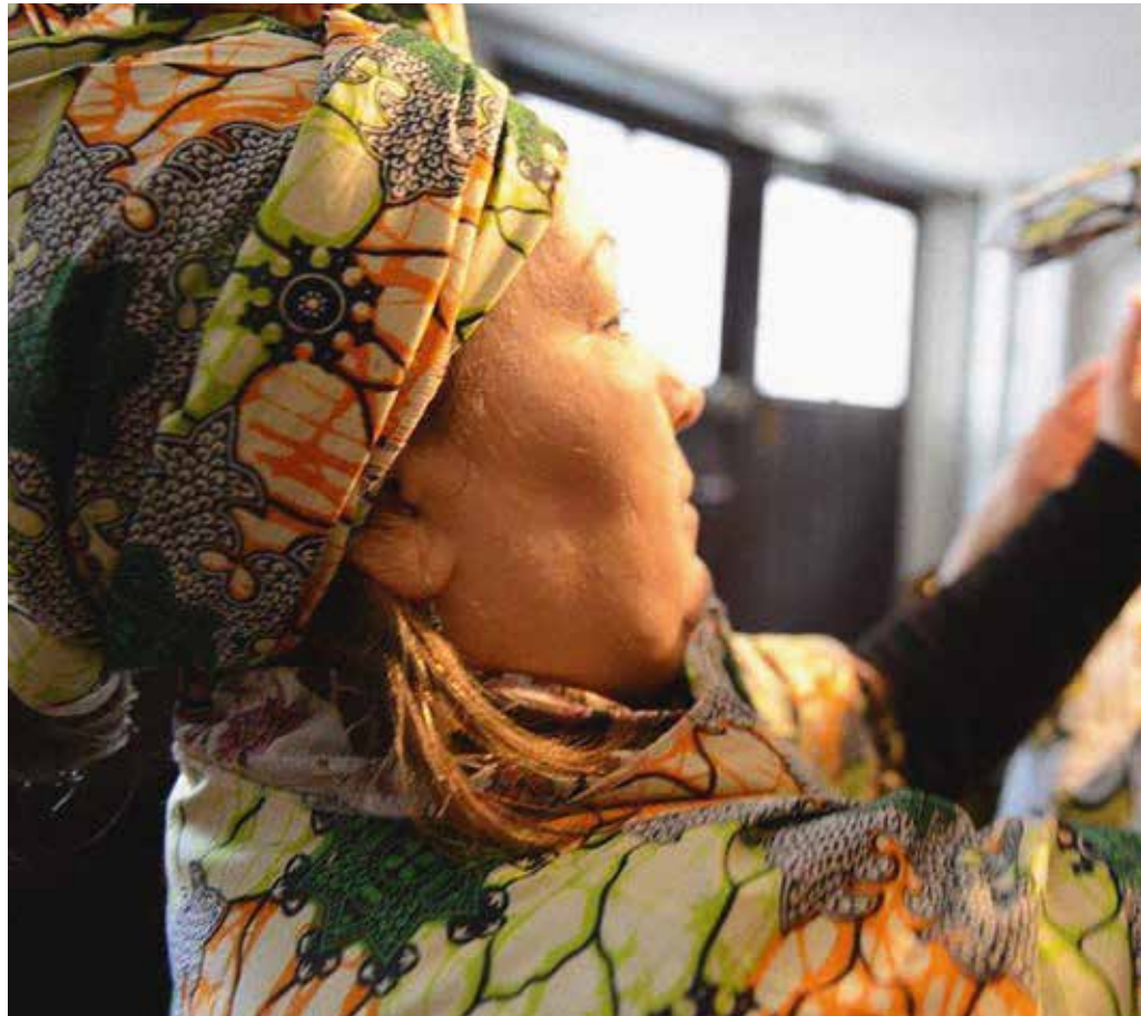
« La robe de la mariée », un spectacle de l'atelier-théâtre du Cactus - De deelnemers aan de theaterworkshop van Cactus brengen "La robe de la mariée"

La conteuse Catherine Pierloz dirige la mise en voix de "Libres de poésie" Vertelster Catherine Pierloz zorgt voor begeleiding tijdens de voordracht van "Libres de poésie"