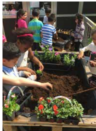
Les petits écoliers prennent soin du potager qu'ils ont créé dans la cour de récréation.