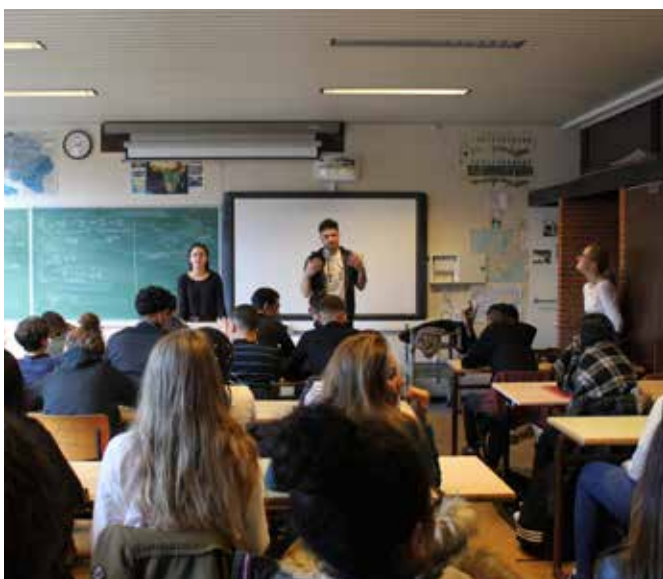
Escale du Nord abordera le thème du "harcèlement à l'école" avec des élèves de l'Athénée Joseph Bracops

Plus d'infos : www.escaledunord.brussels/adn