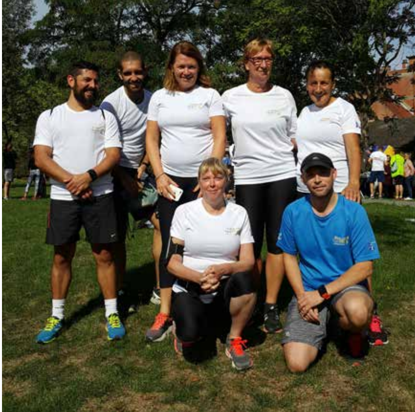
La running team d'Anderlecht - Het running team van Anderlecht