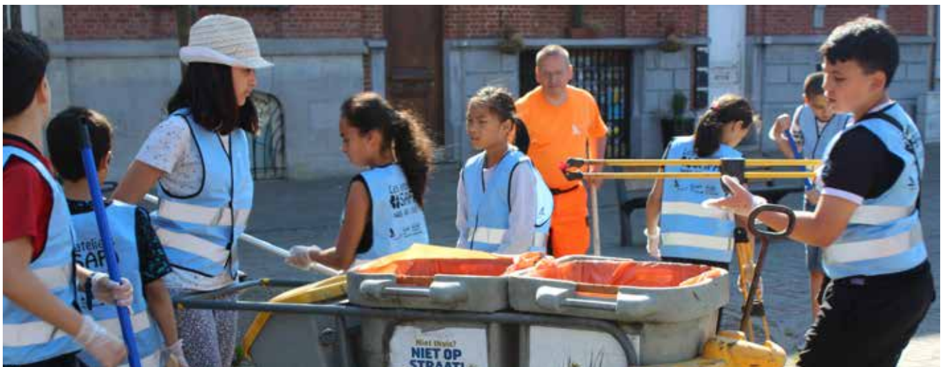
Lors des opérations «Tornades propreté», ce sont les enfants qui montrent l'exemple / De kinderen gaven het goede voorbeeld tijdens de «Netheidstornado's».

Un appel à projet a été lancé avec Escale du Nord pour réaliser des interventions artistiques sur le Square Robert Pequeur, les pieds d'arbres dans la rue Brogniez, le mur du cours Saint-Guidon et deux murs situés place de la Résistance. Les artistes sélectionnés sont Chloé & Charles et Urbana Project (à l'origine notamment de la fresque à la sortie du métro Aumale).