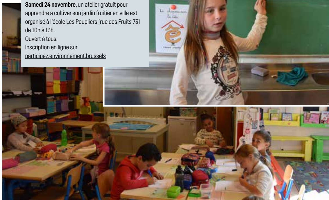
Ce sont les enfants eux-mêmes qui agissent et informent leur entourage!

Inscription en ligne sur participez.environnement.brussels