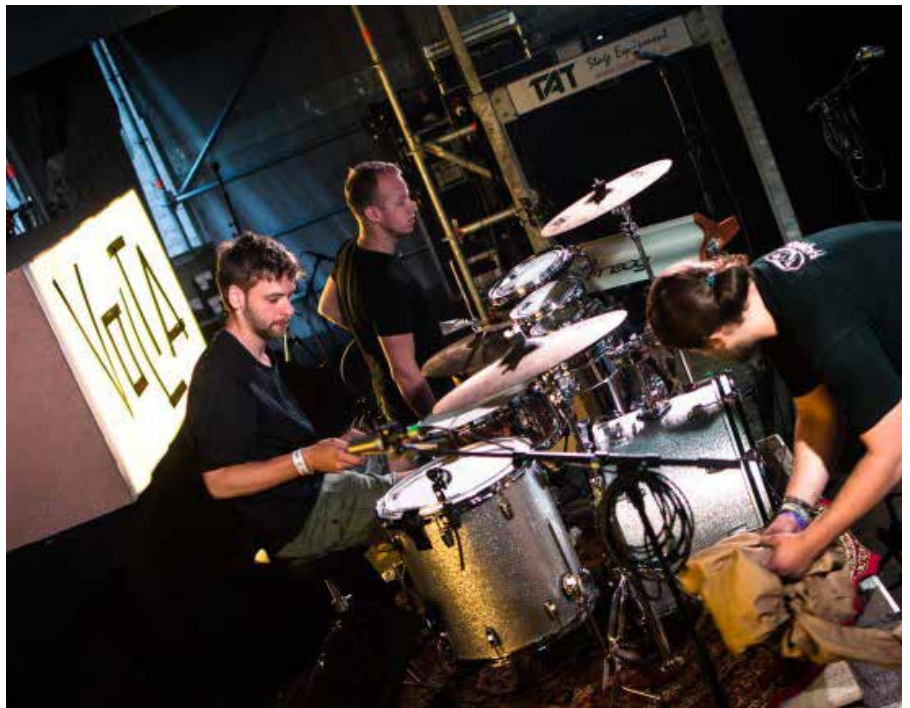
12 studios d'enregistrement vont ouvrir au Volta, le nouveau hub musical de la capitale. Volta, de nieuwe muzikale hub in onze hoofdstad, telt binnenkort 12 opnamestudio's.

In Anderlecht werd een nieuwe plaats ingehuldigd waar aanstormend Brussels talent muziek kan produceren en elkaar kan ontmoeten. Volta bevindt zich in Studio CityGate (Grondelsstraat 152) en omvat twaalf opnamestudio's en repetitieruimtes, leslokalen en een podium voor opkomende muzikanten die in cafeetjes in het centrum spelen, maar nog niet de kans kregen om op te treden in grote concertzalen.