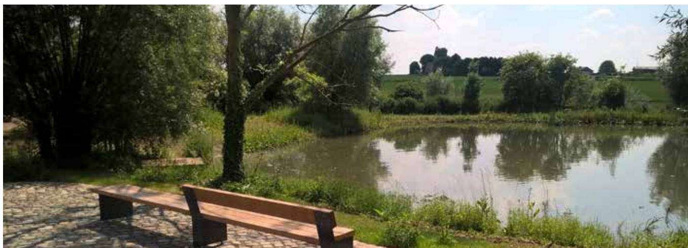
Le 20 mars, venez vous balader dans le nouveau parc du Vogelzang! - Kom op 20 maart wandelen in het nieuwe Vogelzangpark!