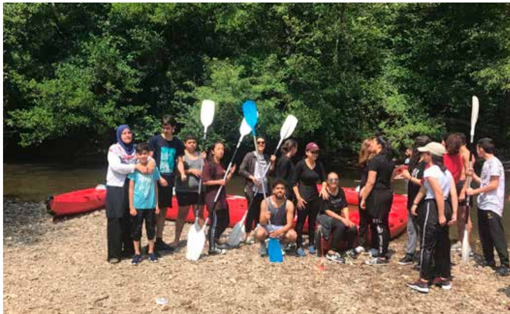
Les jeunes de l'asbl SAFA mettent sur pied des activités intergénérationnelles - De jongeren van vzw SAFA gaan intergenerationele activiteiten organiseren.

L'Université Populaire d'Anderlecht va créer un jardin potager coopératif sur un toit-terrasse de 100 m 2 , ainsi qu'une formation en maraîchage urbain. Un marché de troc sera éga-