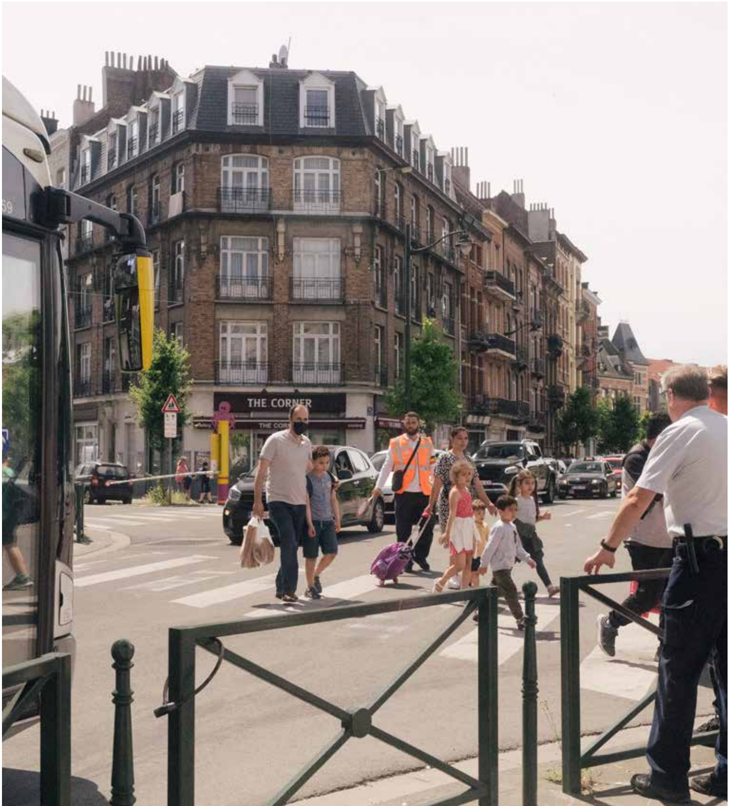
Sortie d'école supervisée par la police, lors d'une formation des Gardiens de la paix. Einde schooldag onder toezicht van de politie tijdens de opleiding van de gemeenschapswachten.