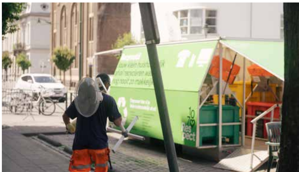
Des mini-recyparks sont organisés tous les jours à travers la Commune. Er staan elke dag mini-recyparks op verschillende plaatsen in de gemeente.

nl. Het netheidsplan is een jaar geleden opgestart met de inrichting van mini-recyparks, een verhoging van het aantal straatvegers voor een frequentere reiniging en een meer regelmatige lediging van vuilnisbakken, en de invoering van de “nette wijk”: een operatie die ons in staat stelt de netheid van de wijken grondig aan te pakken, maar ook om de inwoners te sensibiliseren en overlast te bestraffen. Dankzij nieuwe camera's kunnen daders van sluike storingen worden opgespoord. In de komende jaren zullen er meer straatvuilnisbakken worden geplaatst, ondergrondse containers worden getest en recyclageplaatsen worden opgezet.