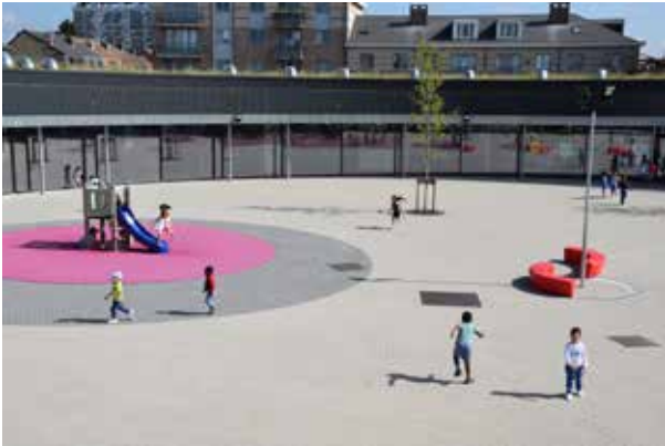
240 places ont été créées dans les écoles communales. 240 extra plaatsen in gemeentelijke scholen.