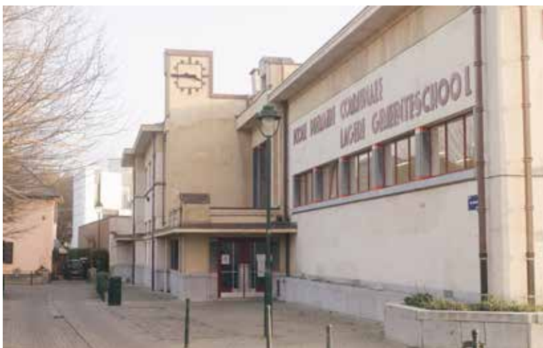
De grands travaux de rénovation sont en cours dans les cités-jardins de La Roue et du Bon-Air.

In Veeweide werden nieuwe kantoren geopend voor het administratief personeel. Ook de Frankrijkstraat kreeg nieuwe kantoren voor het onthaal van de bevolking. Daarnaast werd er een nieuwe feestzaal "Java" geopend met een capaciteit van 500 zittende en 800 staande personen. Aan infrastructuurprojecten is er de komende jaren geen gebrek: zo wordt er een nieuwe school gebouwd (P18) in de Vijverswijk, komen er sporthallen in Neerpede en Peterbos en wordt er een bowlingbaan geopend aan de Olympische Dreef.