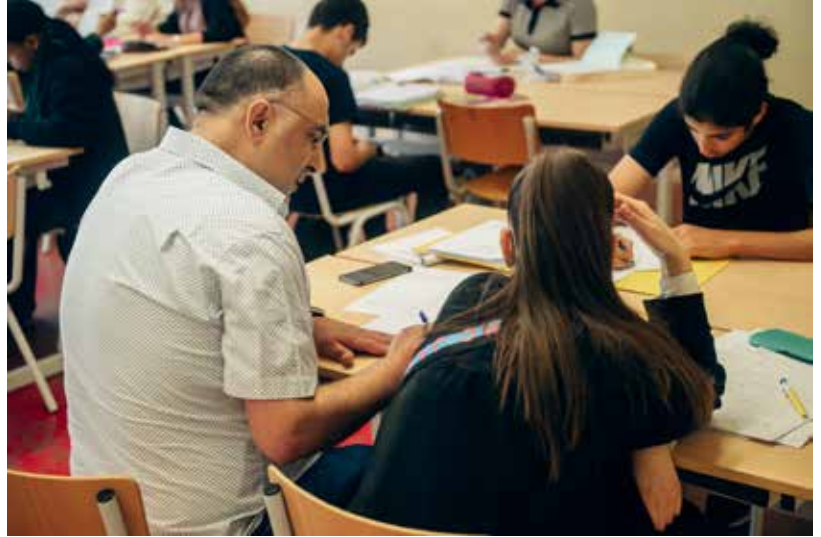
Le FEFA asbl poursuit la lutte contre le décrochage scolaire. Vzw FEFA zet de strijd tegen schooluitval voort.

fr. À Anderlecht, plus d'un quart des habitant·e·s ont moins de 25 ans. Offrir une place à tous les enfants et un lieu où chaque jeune puisse s'émanciper et vivre pleinement sa vie de citoyen·ne est un défi pour notre commune.