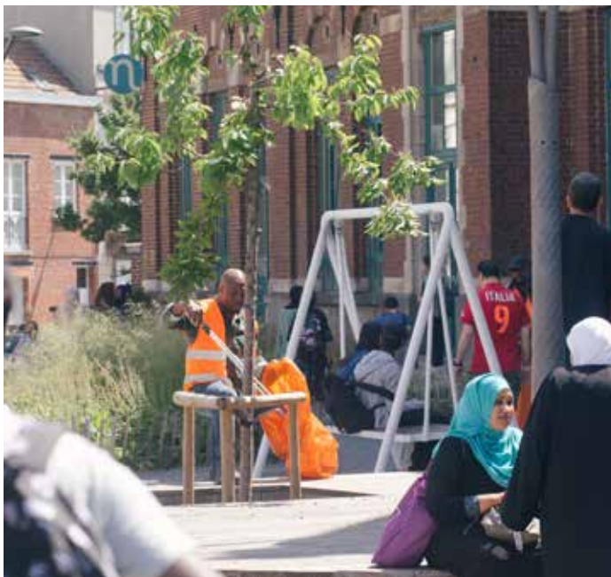
Les balancelles devant l'école Dertien, à l'angle de la rue Wayez et de la rue de Douvres.

Schommels voor school Dertien, op de hoek van de Wayezstraat en de Doverstraat.