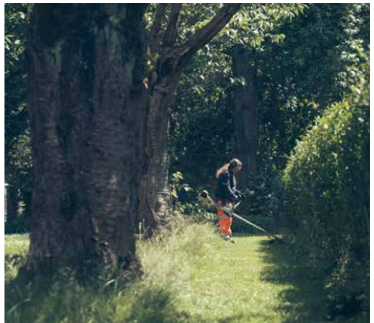
Entretien des espaces verts, avenue Claeterbosch.

Schommels voor school Dertien, op de hoek van de Wayezstraat en de Doverstraat.