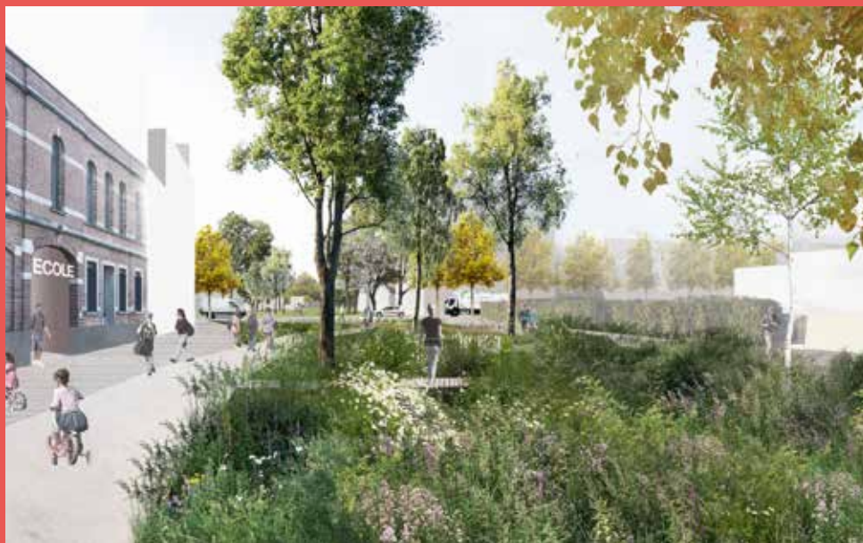
Illustration du futur aménagement possible du parc Petite-Île - Illustratie van de mogelijke toekomstige ontwikkelingen van het park van Petite-Île

Beliris gaat in de nabije toekomst bouwaanvragen indienen om deze projecten te realiseren.