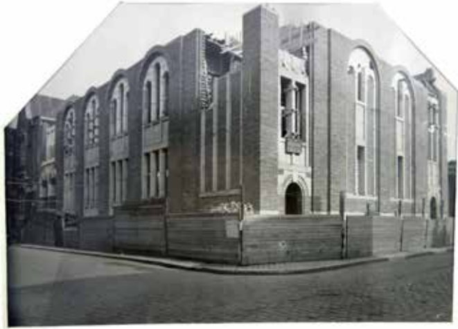
La fin de la construction de la synagogue de la communauté israélite orthodoxe de Bruxelles au coin des rues de la Clinique et du Chapeau à Anderlecht - ca. 1930 - Het einde van de bouw van de synagoge van de orthodox-joodse gemeenschap van Brussel op de hoek van de Kliniekstraat en de Hoedstraat in Anderlecht - ca. 1930

fr. Après la Première Guerre mondiale, le flux d'immigrants juifs ne cesse de croître et une population juive importante s'établit, entre autres, à Anderlecht. La nécessité de construire une grande synagogue se fait de plus en plus pressante. Dans cette perspective, la communauté israélite orthodoxe de Bruxelles acquiert en 1926 un terrain situé à Anderlecht, au coin des rues de la Clinique et du Chapeau. Le projet est confié à l'architecte