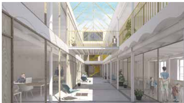
Le futur espace Liverpool - De toekomstige Liverpool-ruimte (© V+)

meer te bundelen. Deze oude drukkerij zal dus binnenkort zowel gemeentelijke diensten als verenigingen huisvesten. De verenigingen van Anderlecht krijgen met andere woorden lokalen die aangepast zijn aan hun activiteiten. De aangeboden activiteiten richten zich op meerdere generaties, maar werken ook rond samenhang en samenleven (bijlessen, computercursussen, opleidingen, danscursussen/voorstellingen, muziek- of zangcursussen/herhalingen/voorstellingen, alfabetisering, enz.) Deze gezellige plaats zal bureaus voor vaste loketten bevatten,