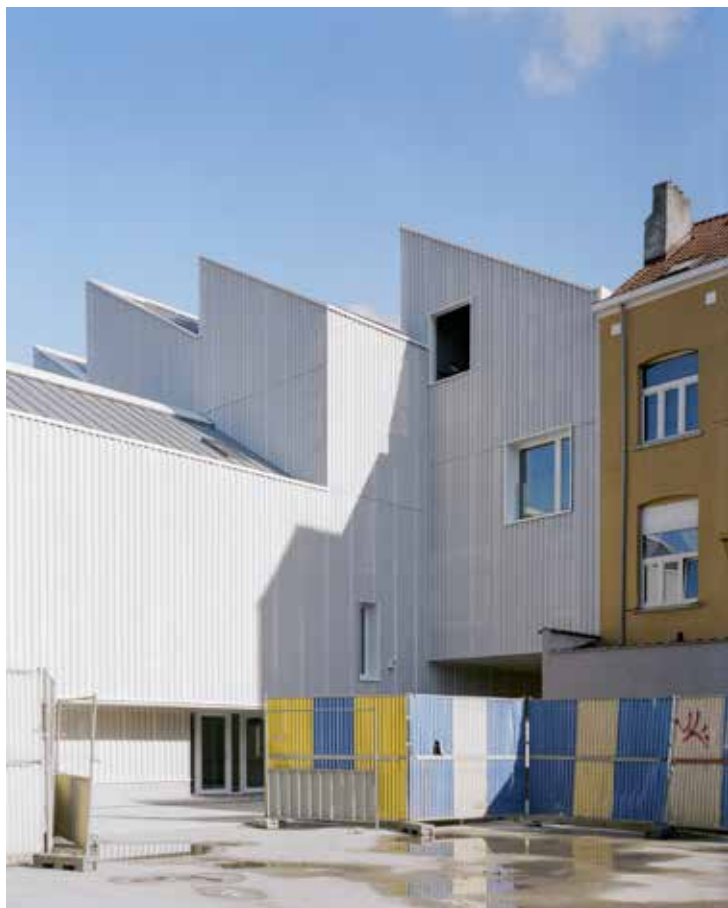
Séverin Malaud © urban.brussels