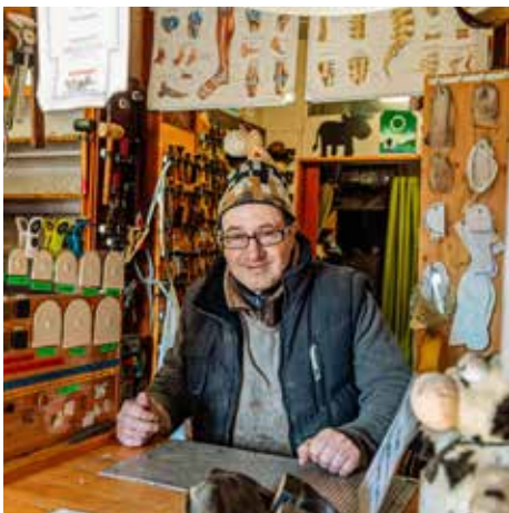
Guy, cordonnier - schoenmaker