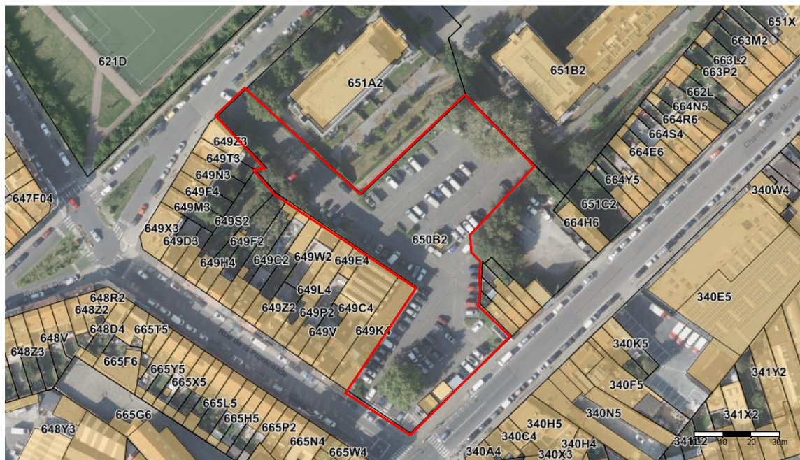
(c) Brugis for data. (c) CIRB for Urbis basemap