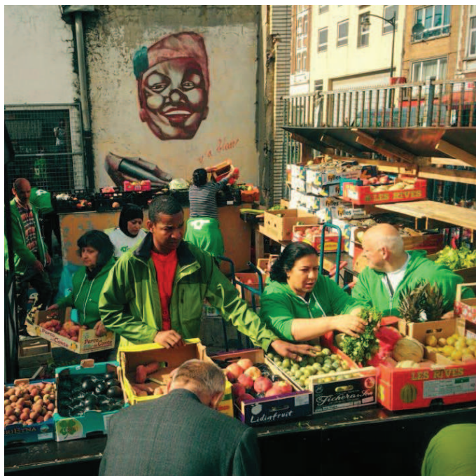
- recyclage des invendus des Abattoirs, Cultureghem ASBL -