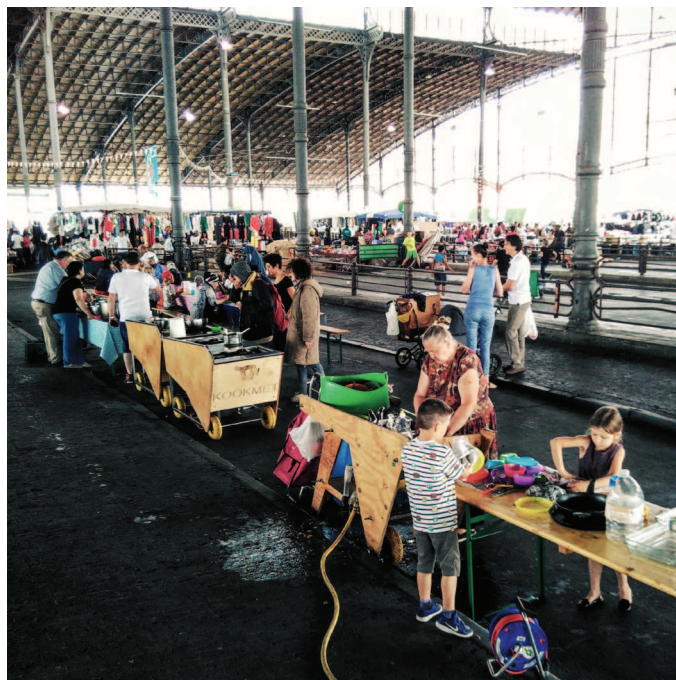
- atelier pédagogiques sous la grande halle, Cultureghem ASBL -