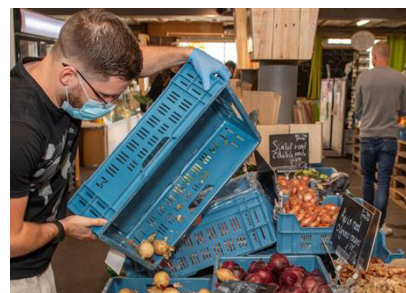
the Food Hub, Atelier Groot Eiland

L'association pourra lancer l'activité agricole dès que la cession des terrains du Foyer à la commune sera formalisée et pourra continuer lors du chantier. Elle devra également gérer et veiller à la bonne utilisation des parcelles allouées aux citoyens.