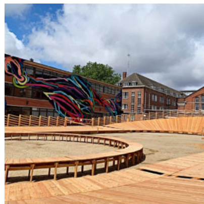
2_ USQUARE, Ixelles Elsene

_ Requalifier le bâti et animer et valoriser les rez-de-chaussée.