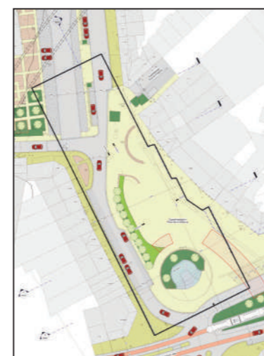
Geplande plaatsinneming van de ondergrondse parking.

basis van zijn architectonische en erfgoedkundige troeven, en de nieuw gerenoveerde openbare ruimten weer terug aan de burger geven, ook 's nachts.