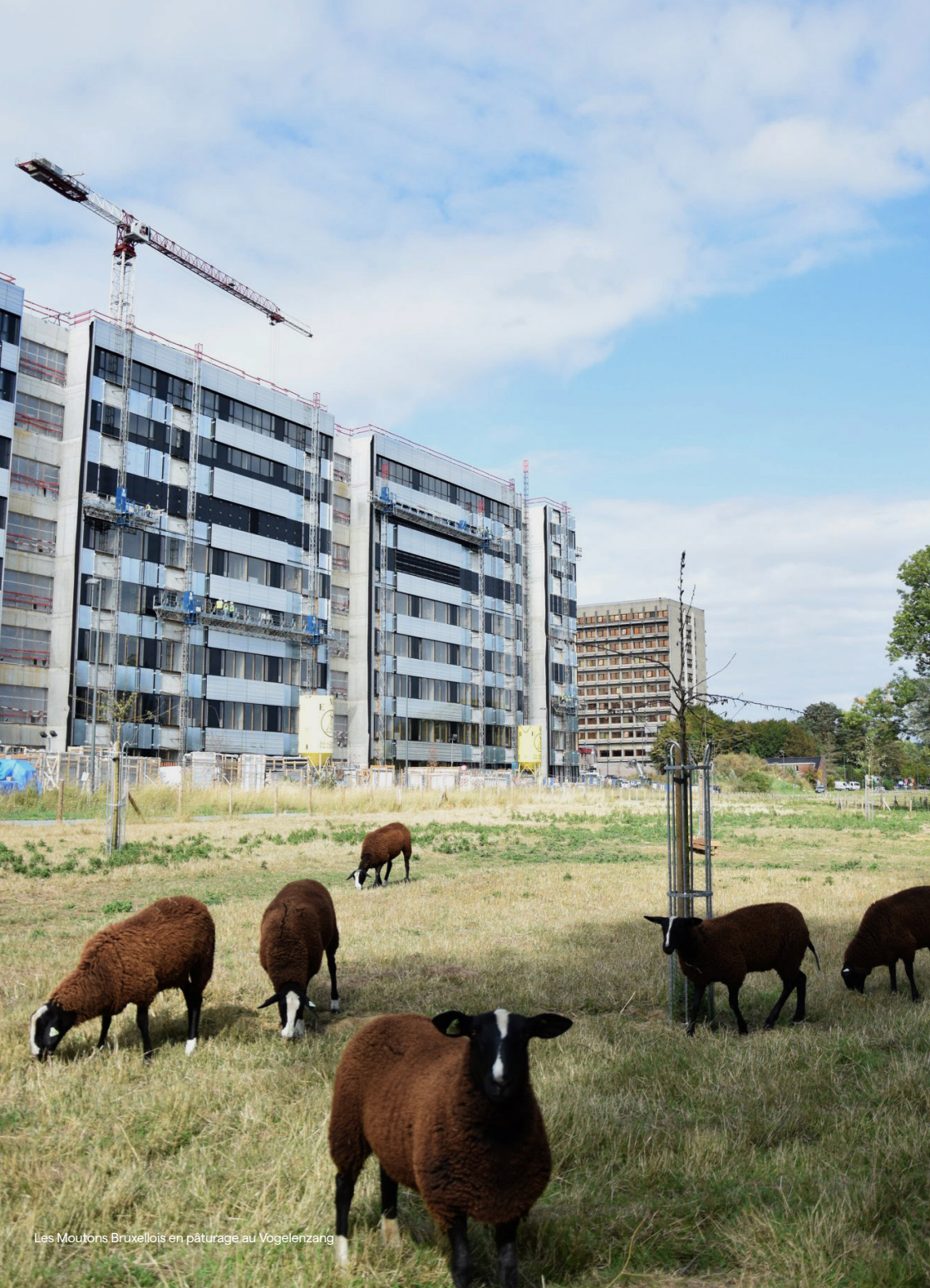
Les Moutons Bruxellois en pâturage au Vogelenzang