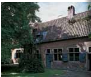
De 11 musea