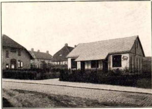
Home de la « Jeunesse ouvrière »

espèces citées plus haut, mais qui peuvent leur donner une grande satisfaction quand ils obtiendront des sujets impeccables, dignes de figurer à une exposition.