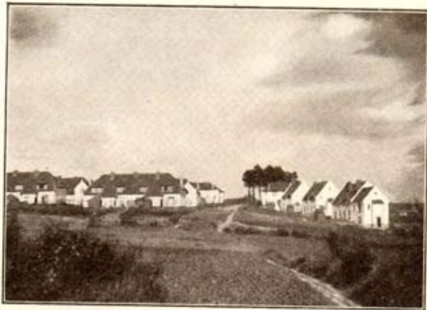
Coin sud-ouest de la Cité (vue prise du Pipozyt)