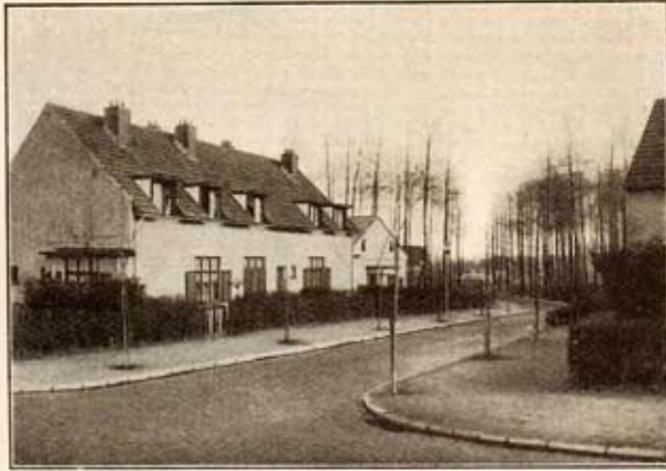
Rue de Sévigné (sortie)