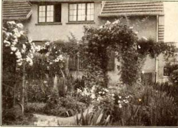
Jardin d'une habitation

Voici notre moyen, qui ne demande rien de spécial et qui nous a permis, depuis nombre d'années, de manger des œufs de 20 semaines, sans que le palais le plus délicat trouve une différence avec des œufs fraîchement pondus.