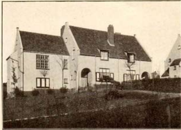
Siège des « Foyers Collectifs » (Rue Shakespeare)

De la plantation dépend la vie d'un arbre pendant de longues années. Mettez-y tous les soins nécessaires.