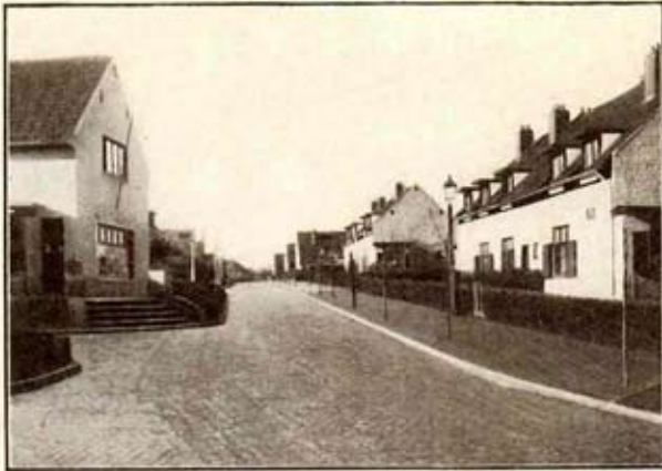
Rue de Sévigné (entrée)