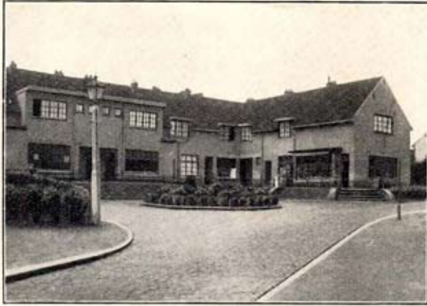
Groupe des quatre maisons de commerce

1 o Nos maisons ont été conçues en prévision de l'occupation de chacune d'elles par une famille.