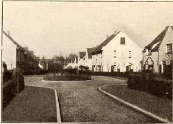
Placette de la rue Virgile

Soignons bien nos haies. Elles seront une belle démarcation et d'un ensemble parfait. Elles ne doivent pas avoir plus de 1 m 50 de hauteur et 25 centimètres d'épaisseur.