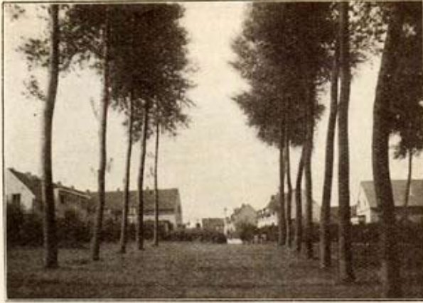
Pré arboré — Rue de l'Agronome

2° N'utilisons pas la maison à un autre usage que celui d'habitation. Elle ne peut, d'ailleurs, pas servir à l'usage de commerce ou d'industrie, et elle ne peut porter ni enseigne, ni réclame, ni pancarte.