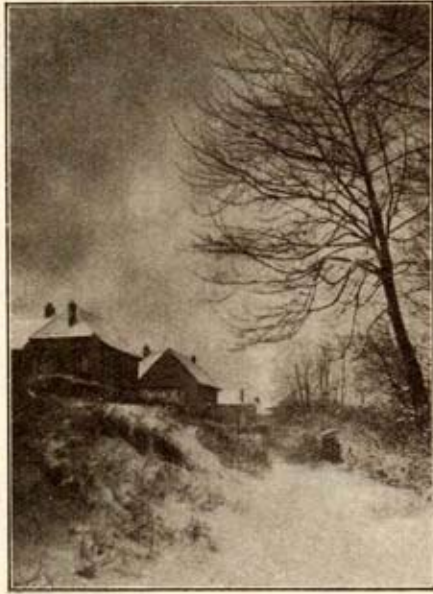
Rue Van Soubt (sous la neige)