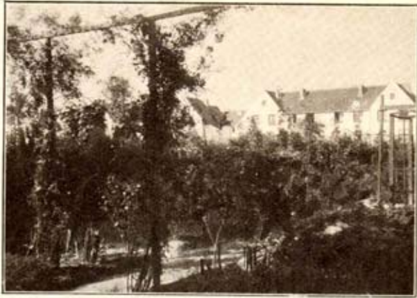
Coin de jardin