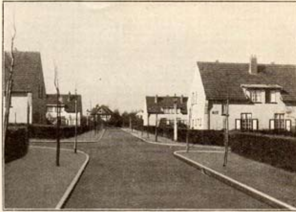
Carrefour des rues de Sévigné et Virgile

Si nous avons un voisin qui ne comprend pas, malgré tout, la joie de vivre dans notre Cité, d'avoir une habitation saine et un jardin proprement entretenu, qui est maladroit des mains ou sans expérience, ne nous fâchons pas. Essayons de le persuader en profitant de toute occasion pour lui faire partager notre amour pour le beau et l'agréable, pour lui apprendre à manier la bêche ou pour obtenir de lui un léger effort. Quand il aura compris, il nous en sera certainement reconnaissant.